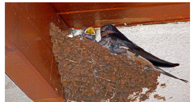
'Zelfs de mus vindt een huis en de zwaluw een nest waarin ze haar jongen neerlegt..' Psalm 84:4

Wij kunnen met de voedselhulp enkele honderden mensen helpen. Wij willen er zijn voor mensen in Israël die honger naar de komst van de Messias en hen geestelijk voedsel geven. Niet opdringerig, maar antwoord geven op gestelde vragen