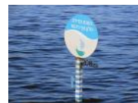
Deze foto nam ik één maand geleden. Nu nog maar 14 centimeter, dan is het Meer zó vol dat de sluisen open kunnen en het overtollige water de Jordaan in kan stromen.

Wij hoorden verhalen van Arabische pastors over tieners die zeggen: "Pastor ik wil mijn leven toewijden aan de Heer, ik wil er bij zijn als Jezus komt!"