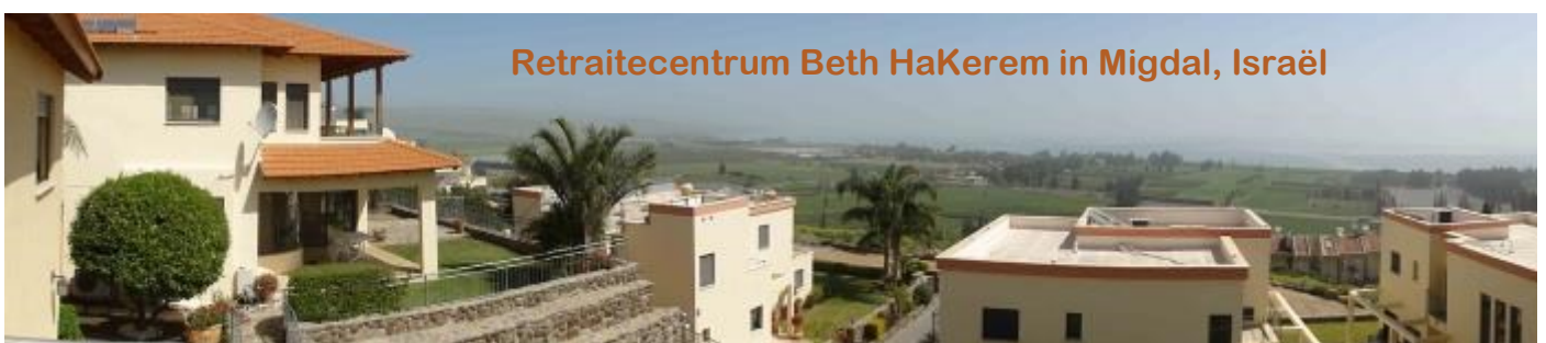
Retraitecentrum Beth HaKerem in Migdal, Israël