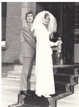
10 augustus 1972

Op de receptie van ons afscheid als voorgangers-echtpaar in Amsterdam merkte een goed menende broeder op: 'Heerlijk! Nu kunnen jullie het lekker rustig aan doen'. Alleen al de gedachte aan het turen achter de geraniums bracht rillingen op onze rug. Sinds 2013 zijn wij volop actief in het bezoeken van onze vrienden in Israël, het organiseren van groepsreizen naar