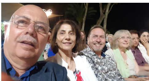
Met Joods/Messiaanse- en Arabische voorgangers tijdens het concert