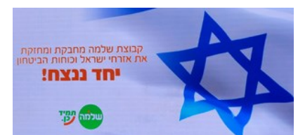
'Alleen samen overwinnen wij'. Deze posters vind je nu overal in Israël.

Ik kreeg zelf vragen over mijn geloof in Jezus en of ik geloof in drie goden... Heb ik met groot genoegen beantwoord! En ik vertelde dat overal in Nederland dagelijks voor Israël gebeden wordt. In deze moeilijke tijd mogen Israëliërs ervaren wie hun echte vrienden zijn.