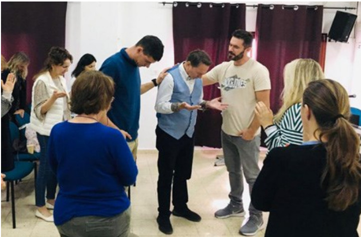
In een Israëlsche gemeente waar ik heb gediend met het Woord, werd na afloop gebeden voor mijn bezoeken aan de voorgangers.